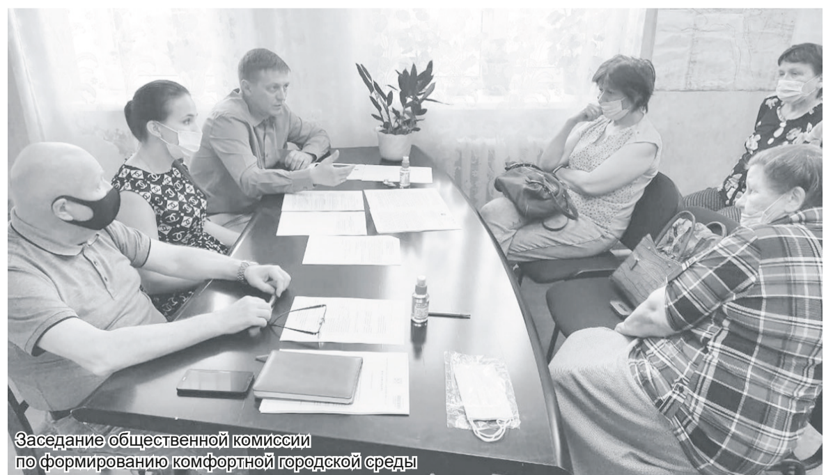
Заседание общественной комиссии по формированию комфортной городской среды

Выводы пока делать сложно. Да, есть очереди на паром в определённое время и дни, например, в пятницу вечером. Есть люди, кто понимает, что паром – крайняя