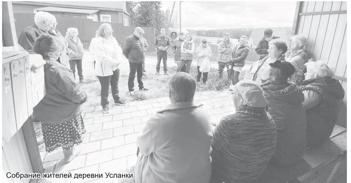
Собрание жителей деревни Усланки

- Это идёт капитальный ремонт многоквартирных домов. Сначала наши дома попали в конец программы, рассчитанной до 2040 года. Администрация поселения, благодаря инициативе жителей и управляющей компании, добилась, что некоторые дома (Школьная, д. 4, 5, 7а, Осташева, д. 14) были включены в краткосрочный план программы капитального ремонта. Принцип работы Фонда капитального ремонта Ленинградской области таков: они берут один дом и в течение нескольких лет выполняют все виды работ. В нашем случае капремонт рассчитан на три года. Работы начались в 2019 году. В этом году обновят фасады