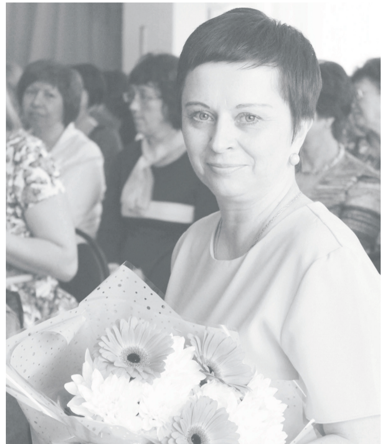
Уважаемые коллеги! Ветераны социальной службы!

На сегодняшний день кадровый состав организации укомплектован квалифицированными специалистами, многие из которых имеют высшее профессиональное образование, обладают большим опытом работы. Приятно отметить, что помимо опытных сотрудников, в организации работают много молодых специалистов, которые отличаются инициативностью и энтузиазмом в работе.