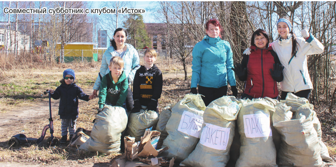
Совместный субботник с клубом «Исток»

После взаимодействия с ними оказалось, что из нашего города такая не одна, кто обратился к ним за советом. В это время они как раз формировали список из городов, участвующих в проекте «Комплексное развитие раздельного сбора в Санкт-Петербурге и Ленинградской области», который проходит при поддержке президентских грантов. Наши обращения повлияли на включение Подпорожья в этот проект, он также проходит в Тихвине, Луге,