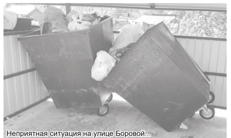
Неприятная ситуация на улице Боровой...

- Это ещё одна наболевшая проблема. На сегодняшний день в деревнях у нас нет ни одной контейнерной площадки твёрдых коммунальных отходов (ТКО). В Важинах есть, но далеко не везде. Хорошо, что мы в 2019 году получили субсидию и смогли оборудовать семь контейнерных площадок, где расположен частный сектор. У многоквартирных домов эти площадки уже были. Но, тем не менее, существующие площадки не отвечают нормам СанПиНа,