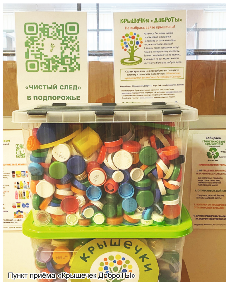
Пункт приёма «Крышечек Доброты»

цензию на её утилизацию. Еще в нашей группе «ВКонтакте» мы провели экологический квест, в котором рассказывали подписчикам об экопривычках, маркировках и переработке. Трёх самых активных участников мы наградили призами от наших спонсоров: иван-чай из экопоселения «Гришино», набор сладо-