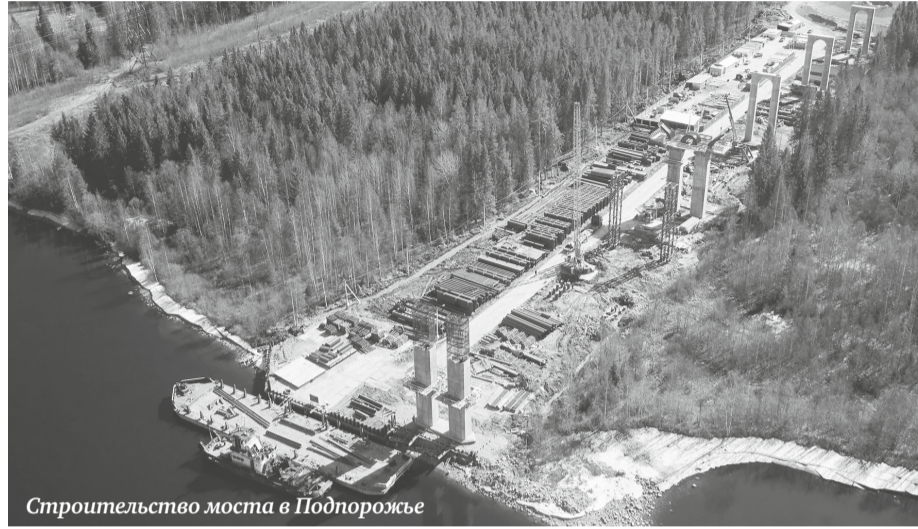
Строительство моста в Подпорожье

На днях, например, стартовали ремонтные работы на дороге Зеленогорск — При-